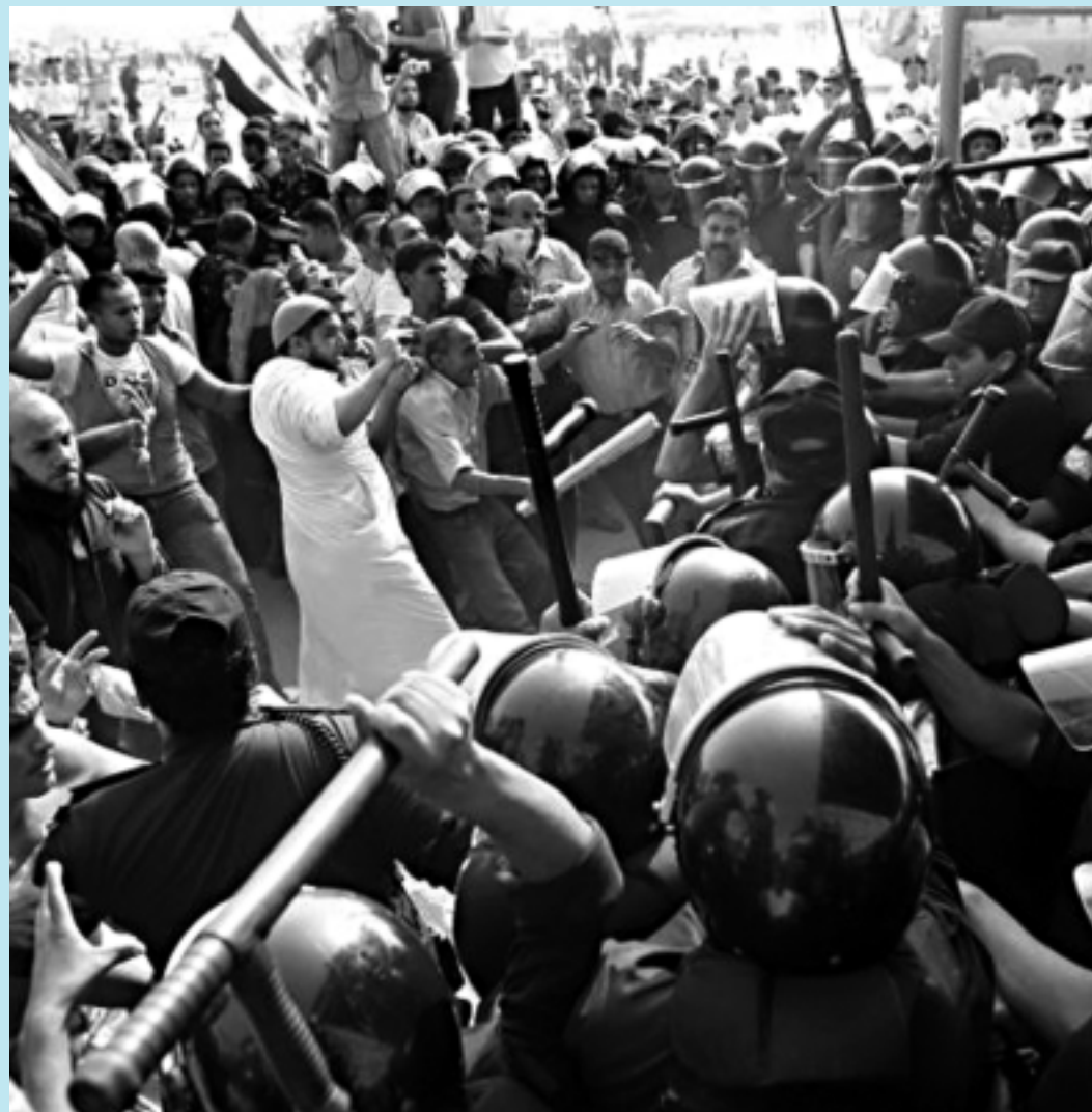
Manifestantes anti-Mubarak entram em confronto com a polícia durante o julgamento, no Egito

O objetivo do comparecimento das testemunhas é determinar se a ordem de abrir fogo contra os manifestantes durante os eventos de janeiro e fevereiro, que resultaram na renúncia de Mubarak, foi dada ou não pelo ex-homem forte do regime.