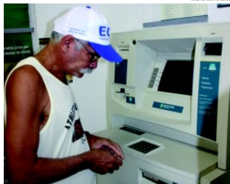
AREIA | Pagamento do 13º se estende até a próxima quinta-feira PÁGINA 17

SERVIÇO Saiba o que abre e o que fecha no feriado