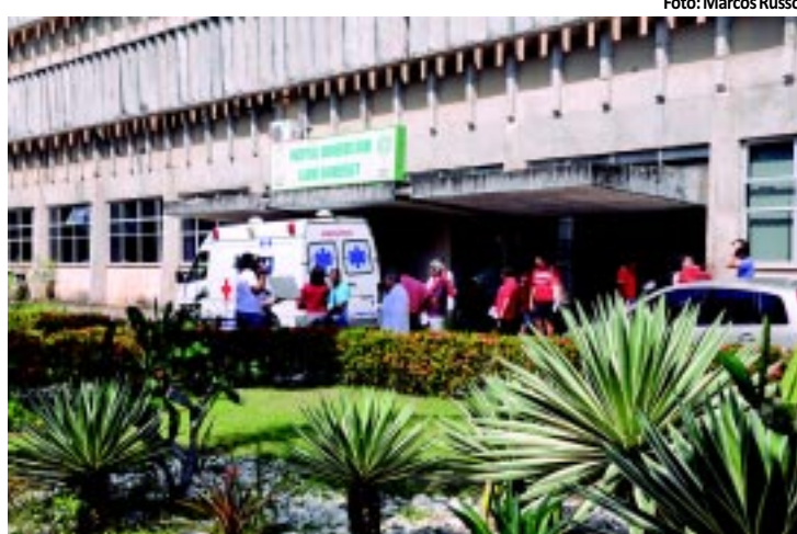
AREIA | Departamento de Doenças Infectocontagiosas está funcionando PÁGINA 10

to o setor conta com nove pacientes internos em tratamento da meningite. Desde o começo do ano, a unidade hospitalar atendeu 82 pacientes com a doença. PÁGINA 10