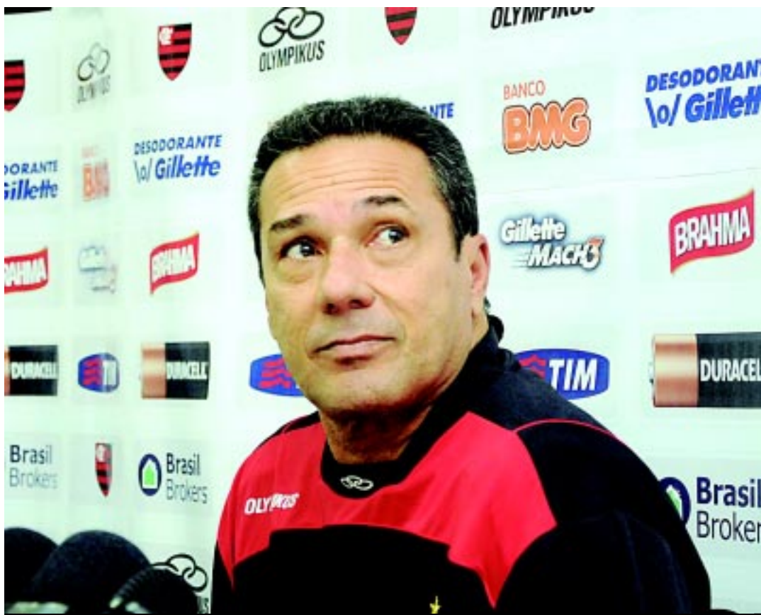
O técnico Vanderlei Luxemburgo nega que o Flamengo não consiga jogar bem sem Ronaldinho