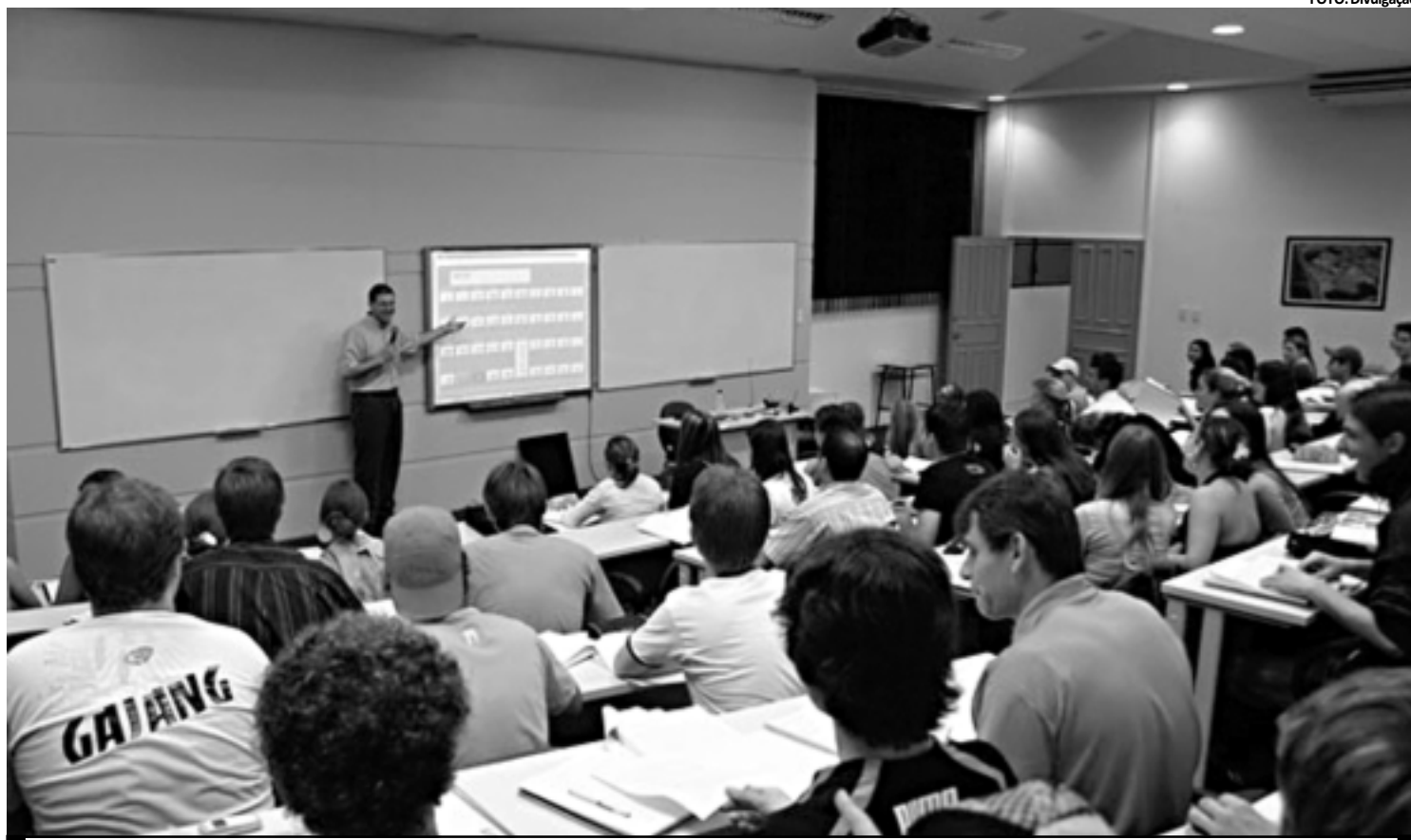
Um bom emprego pode ser resultado do investimentos em cursos, enquanto o gasto com álcool, por exemplo, pode implicar em despesa com saúde

Exemplificou que quem compra um livro ou entra em um curso está pagando mais caro em termos reais por esse tipo de investimento, mas terá retorno mais à frente. “Quanto mais cultura se tem, maior a possibili-