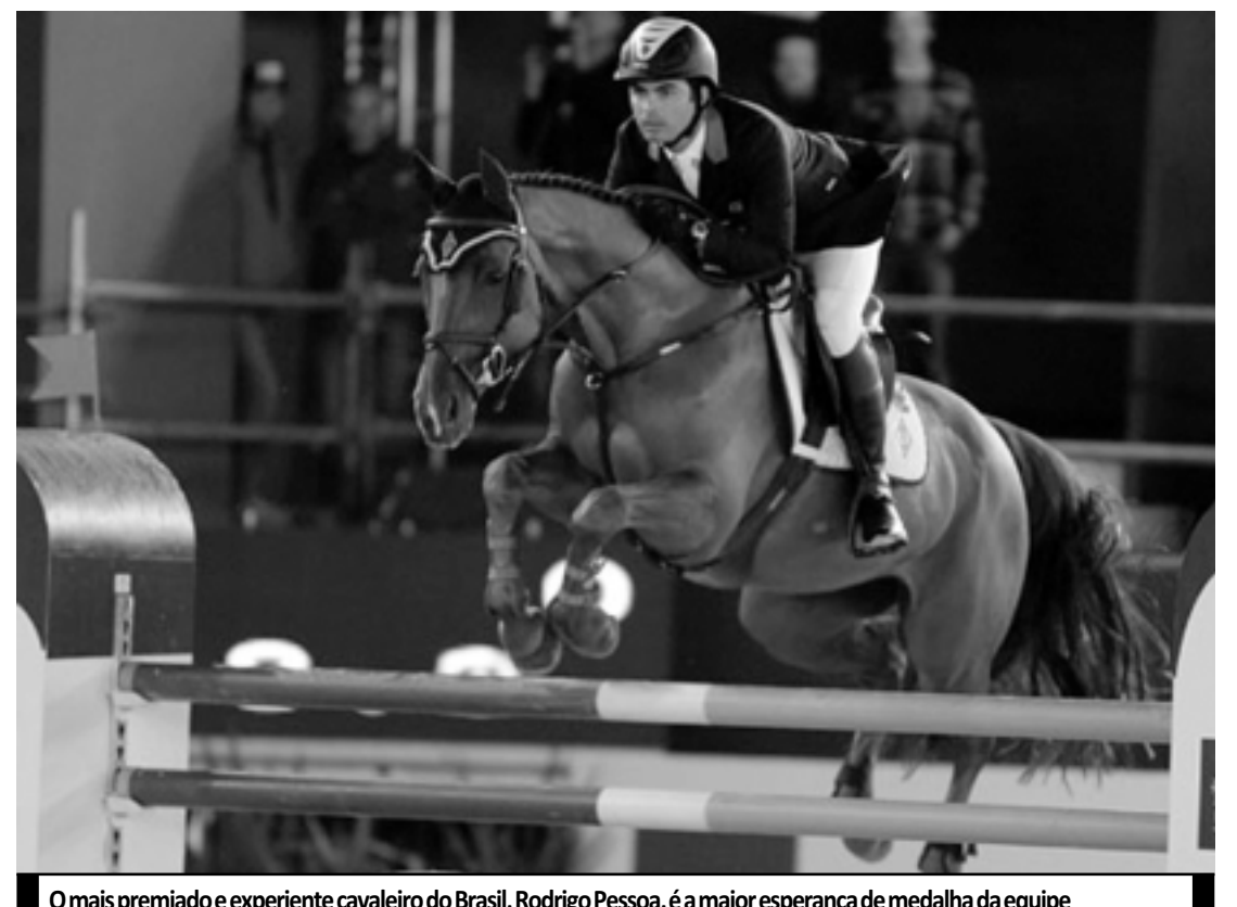
O mais premiado e experiente cavaleiro do Brasil, Rodrigo Pessoa, é a maior esperança de medalha da equipe

O Grande Prêmio da Itália de Fórmula 1 será disputado neste domingo (11), às 9h (de Brasília). Os treinos livres em Monza começam nesta sexta-feira (9), às 5h.