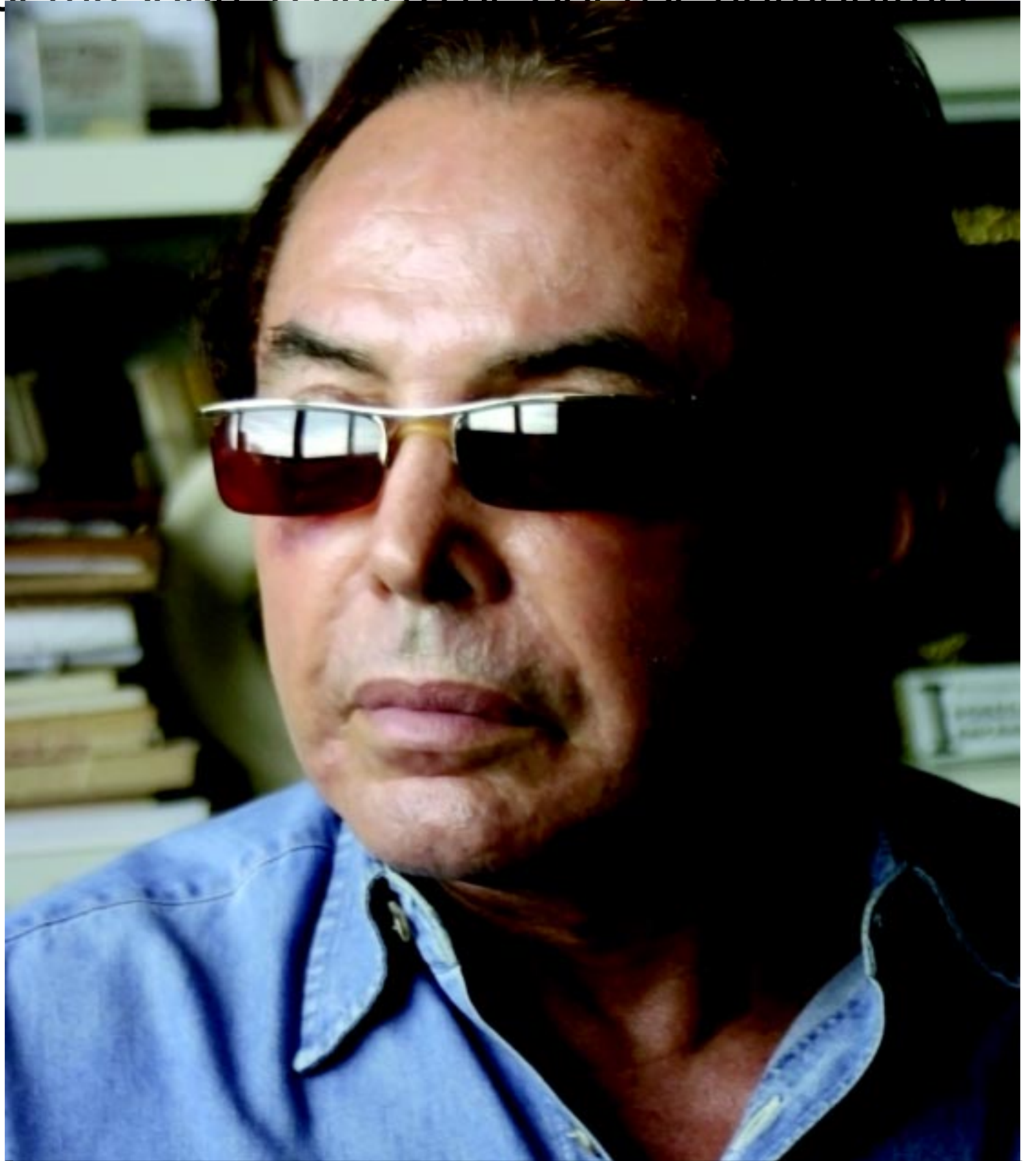
Cerca de 70 mil alunos terão acesso, agora, a um dos livros mais importantes da bibliografia de Políbio Alves, Varadouro , que chega à quinta edição

Dois anos depois, Políbio ganhou repercussão na Argentina