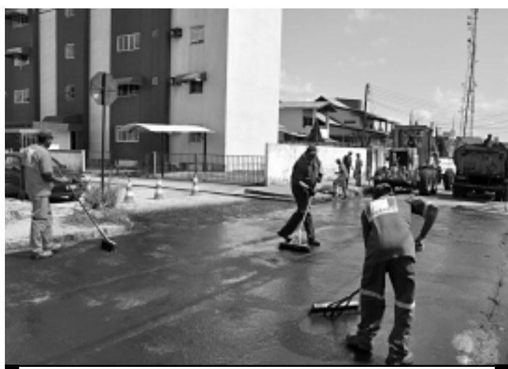
Após Jardim Cidade Universitária, serviço será feito no Castelo Branco

De acordo com informações da Diretoria de Obras, as equipes iniciaram, neste fim de semana, os serviços na Rua Antônio Targino Pessoa da Silveira, onde se localiza grande fluxo de veículos devido à presença de colégios. Aproximadamente 40% do pavimento na via já foram colocados. A previsão é que o serviço seja concluído ainda esta semana. As ruas An-