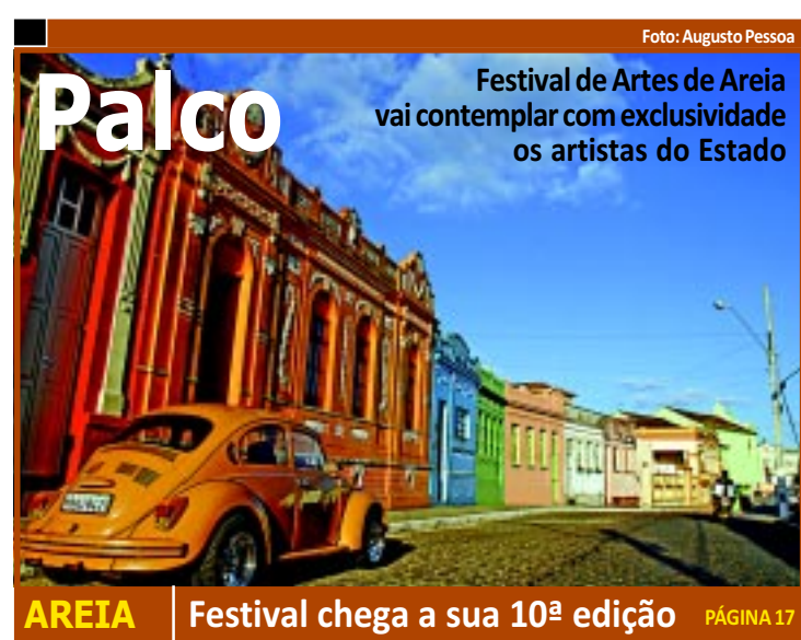
AREIA | Festival chega a sua 10ª edição PÁGINA 17

O mutirão de audiências de conciliação realizado pela Justiça Federal na Paraíba entre os mutuários do Sistema Financeiro de Habitação e a Caixa Econômica resultou em 40% de acordos firmados. PÁGINA 12