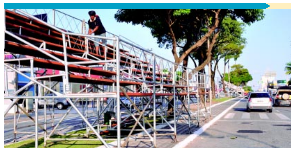
NA CAPITAL | Estrutura para o desfile de 7 de setembro está sendo montada PÁGINA 11

Norte, Rio Grande do Sul e Bahia. A estimativa é que o bando tenha causado um prejuízo de cerca de R$ 500 mil, sobretudo à Caixa Econômica, alvo preferencial do grupo. PÁGINA 9