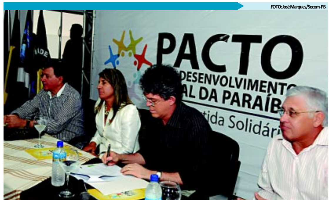
Governo assinou convênios do Pacto pelo Desenvolvimento Social com 15 municípios do Cariri, no valor de R$3,45 milhões

BALANÇO - O governador lembrou que a administração está avançando em todas as frentes de trabalho e que, além da organização da máquina, a gestão conseguiu efetivar grandes programas, como o "Paraíba Faz Educação", o projeto de ressocialização de detentos, o "Pacto Social" e mais recentemente o "Empreender Paraíba": "Estamos viabilizando os principais programas do governo em apenas oito meses de trabalho. Não poupamos esforços e hoje já plantamos as sementes do Empreender Paraíba ou do Pacto Social", disse.