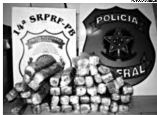
A maconha apreendida seria comercializada em Campina