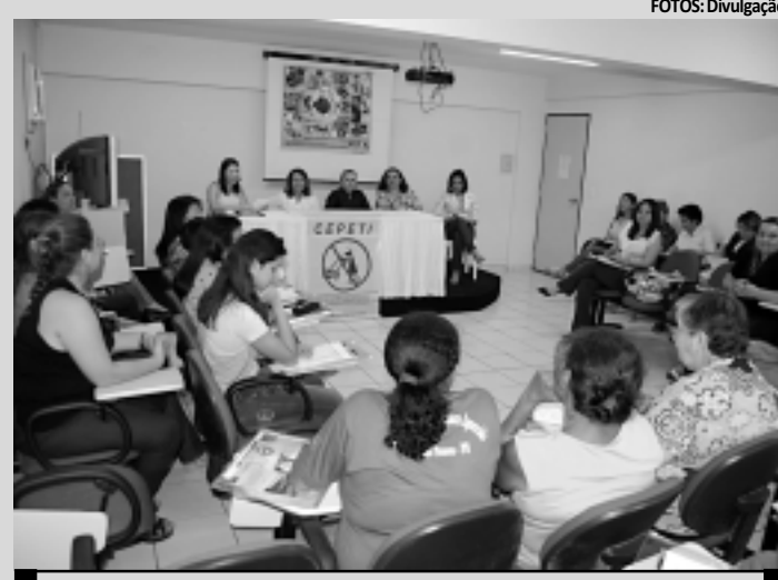
Solenidade de posse dos 28 membros da comissão ocorreu em JP

Cabe ainda aos membros da Cepeti participar da elaboração dos planos locais de enfrentamento ao trabalho infantil, propondo ações e estratégias regio-