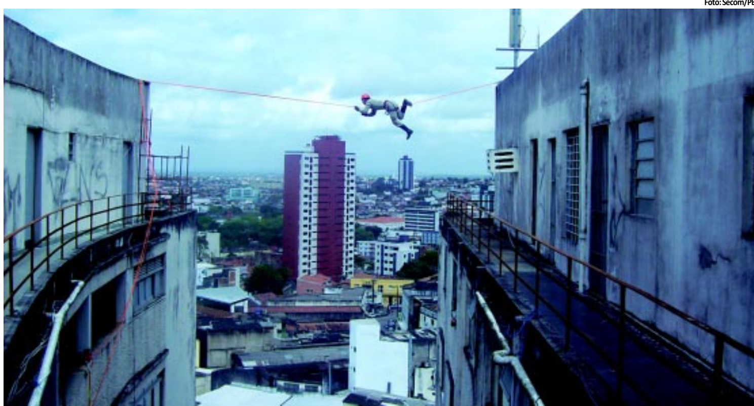
CAMPINA GRANDE | Bombeiros fazem demonstração de salvamento em altura PÁGINA 10

áreas. A solenidade de entrega dos primeiros cheques aconteceu em Campina Grande. Durante o evento, o governador Ricardo Coutinho anunciou para este ano o edital para empreendedores individuais. PÁGINA 12