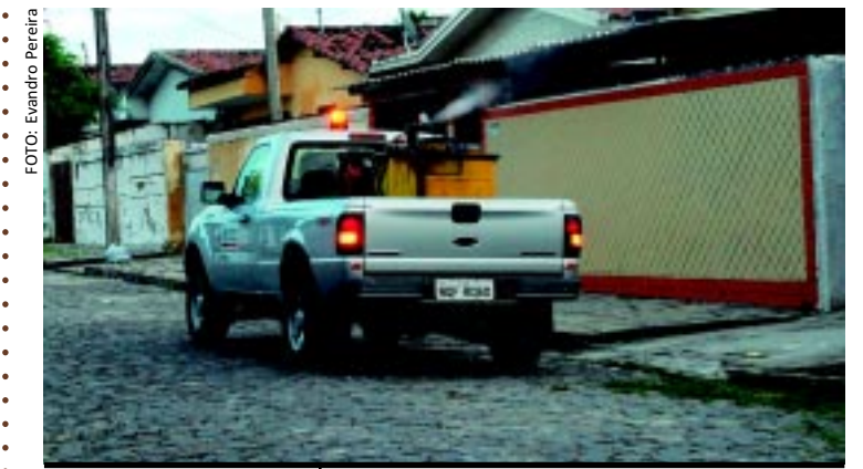
[FOTO&LEGENDA] Novo boletim divulgado pela Secretaria de Saúde da Paraíba, ontem, aponta que a dengue continua em declínio no Estado. Segundo o documento, de 21 a 27 de agosto foram registrados 69 casos suspeitos da doença. Todos sendo investigados.